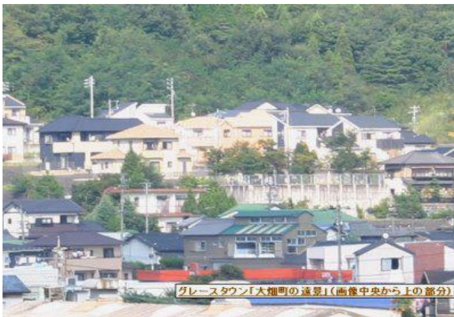
グレースタウン「大畑町の遠景」(画像中央から上の部分)