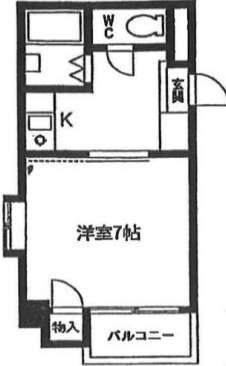
Bタイプ 専有面積：22.10m 2