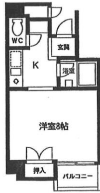
Cタイプ 専有面積：23.99m 2