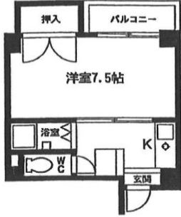
Aタイプ 専有面積：22.91m 2