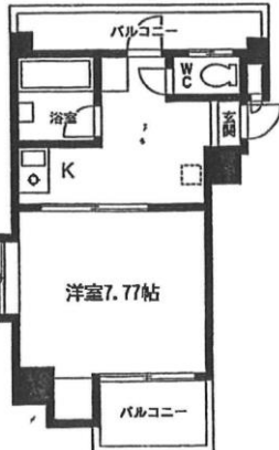
Dタイプ 専有面積：24.92m 2